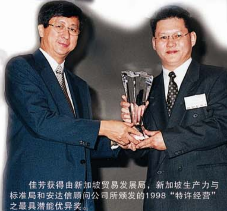
佳芳获得由新加坡贸易发展局，新加坡生产力与标准局和安达信顾问公司所颁发的1998“特许经营”之最具潜能优异奖。