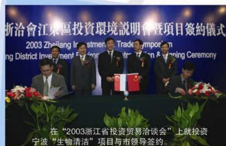
在“2003浙江省投资贸易洽谈会”上就投资宁波“生物清洁”项目与市领导签约。